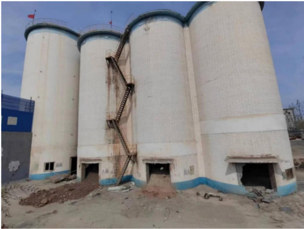
2. 砂岩库库底事故发生位置